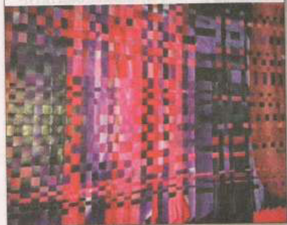
„IRISROSESCHOENWALD“, heißt das Künstler-Trio, das am dem 28. Juli, im H6 zu sehen sein wird.